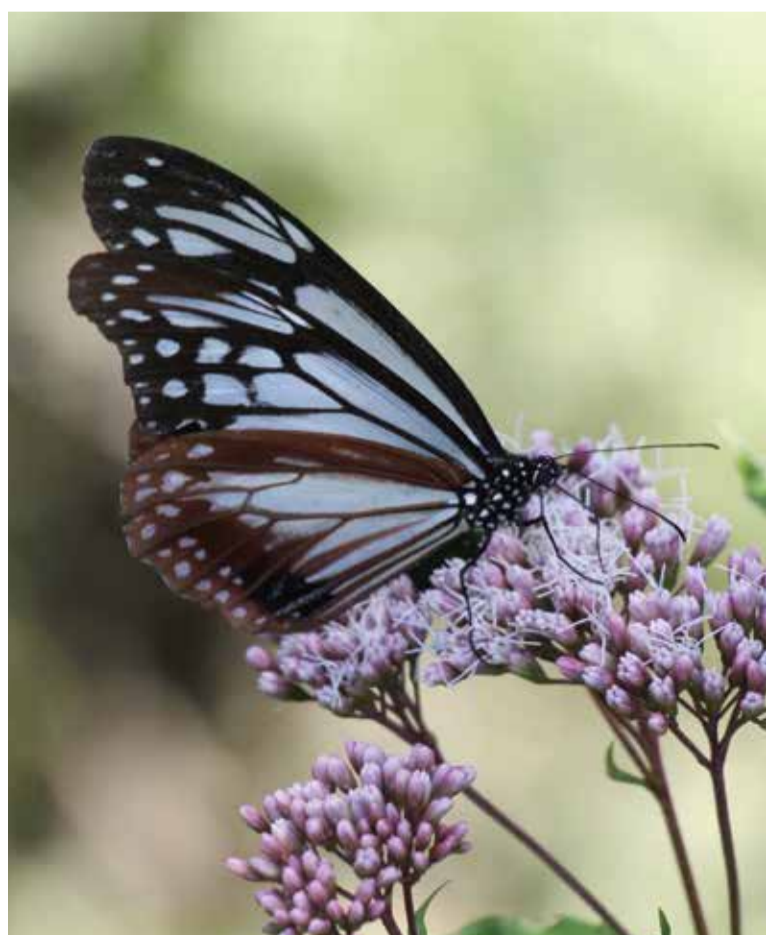
▲フジバカマに止まるアサギマダラ

アサギマダラは気温 25 度のところを好み暑くなると北上し、寒くなると南下します。花公園では標高が高いため長くとどまっています。