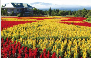
ケイトウ / 6月上旬～6月下旬