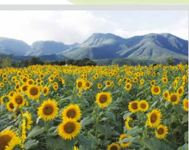
ひまわり / 8月中旬