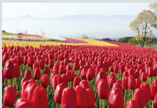
チューリップ / 4月下旬