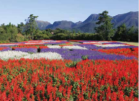
サルビア / 9月上旬～10月下旬