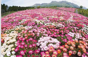
リビングストーンズ / 4月下旬～5月下旬