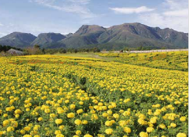
マリーゴールド / 9月上旬～10月下旬