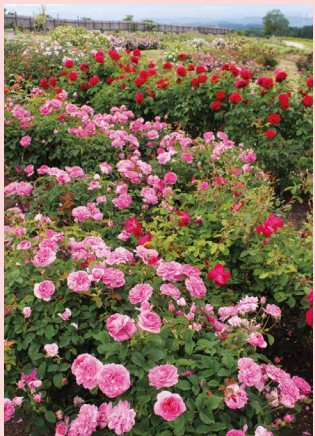
ローズガーデン / 5月下旬～10月中旬

宿根草や花木を中心に彩られた久住ガーデン。300種・ 1500株のローズガーデン、クレマチスとアサギタラが飛 来するフジバカマ配置したクレマチスガーデン。