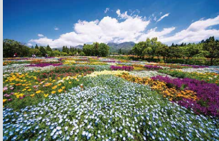
春彩の畑 / 4月下旬～5月下旬