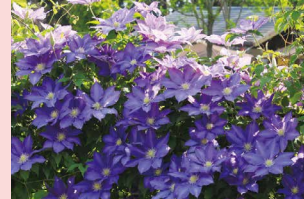
クレマチスガーデン