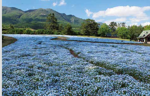
ネモフィラ / 4月下旬～5月下旬