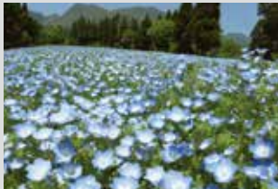
喜林草 / 4月下旬~6月下旬