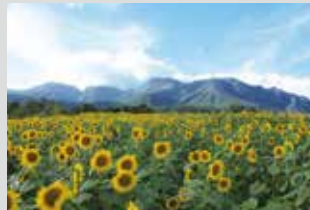
向日葵 / 7月下旬~8月上旬