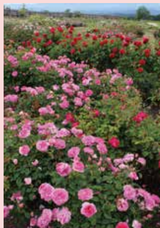
玫瑰花園 / 5月下旬~10月中旬

以宿根草及花木為主妝點而成的鄉村花園。四季各色花卉不斷盛開。350種3500株傳統玫瑰及現代玫瑰打造出華麗風情的玫瑰花園。