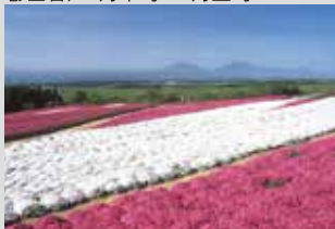
芝櫻 / 4月中旬~5月上旬