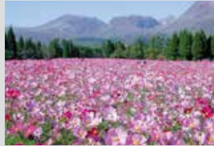
大波斯菊 / 9月下旬~10月中旬