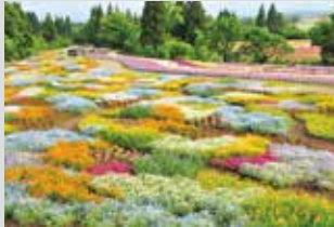
春彩花田 / 4月下旬~5月下旬