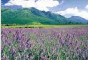
薰衣草 / 6月下旬~7月中旬