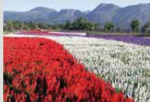
一串紅 / 9月上旬~10月中旬