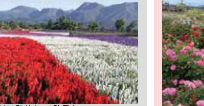
셀비어 / 9월 상순~10월 중순