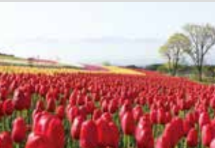
튤립 / 4월 중순~5월 상순