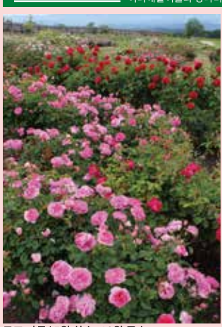
로즈 가든 / 5월 하순~10월 중순

여러해살이풀과 꽃나무를 중심으로 꾸며진 구주 가든과 350종 3천5백 주위의 로즈 가든. 여러해살이풀과 왕나비가 날아드는 등골나물이 있는 클레마티스 가든입니다.