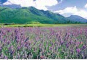
라벤더 / 6월 하순~7월 중순