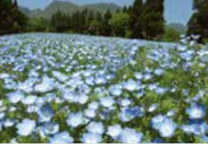
네모필라 / 4월 하순~6월 상순