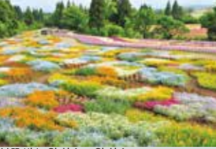
봄꽃 밭 / 4월 하순~5월 하순