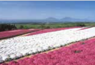
꽃잔디 / 4월 하순~5월 상순