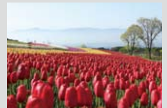
チューリップ / 4月中旬～5月上旬