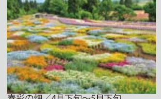
春彩の畑 / 4月下旬～5月下旬