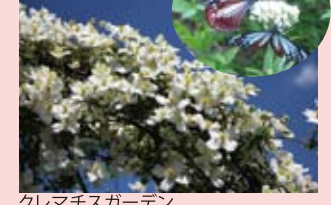
クレマチスガーデン