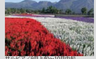
サルビア / 9月上旬～10月中旬