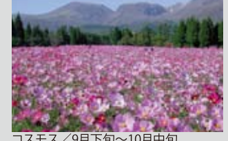
コスモス / 9月下旬～10月中旬