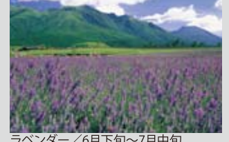
ラベンダー / 6月下旬～7月中旬