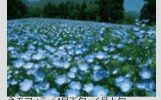
ネモフィラ / 4月下旬～6月上旬