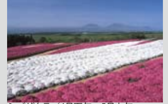
シバサクラ / 4月下旬～5月上旬