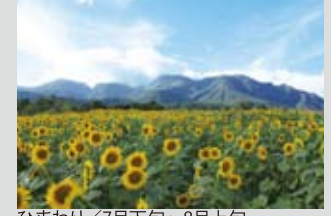
ひまわり / 7月下旬～8月上旬